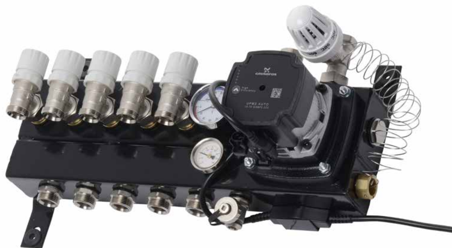
De vloerverwarming wordt geïnstalleerd als onderdeel van de complete W-installatie.

vakkundig hebben gemonteerd, verzorgen zij een revisiepakket, zodat de opdrachtgever alle documenten compleet kan maken. ■